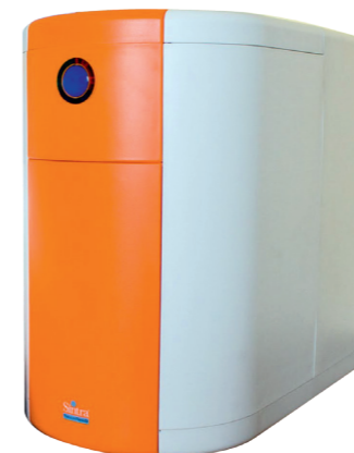
Sintra PressureTank CS