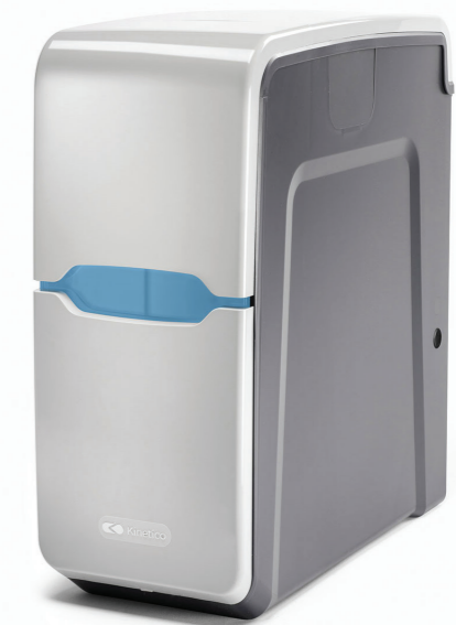
KINETICO PREMIER (USA)