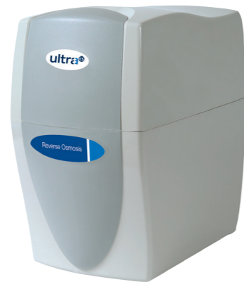
ultra classic CS Reverse Osmosis