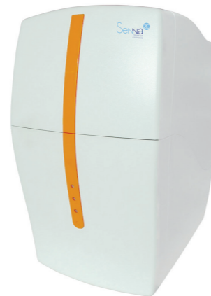
Senna 20 reverse osmosis