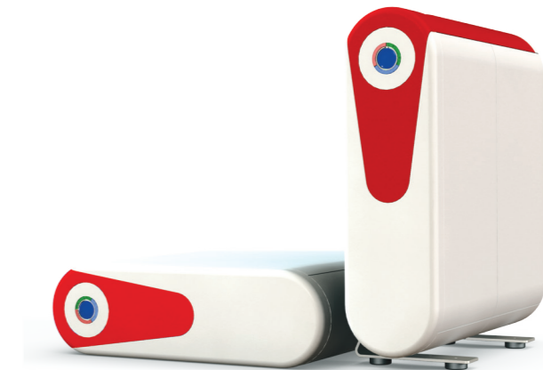
Binature DIRECT FLOW