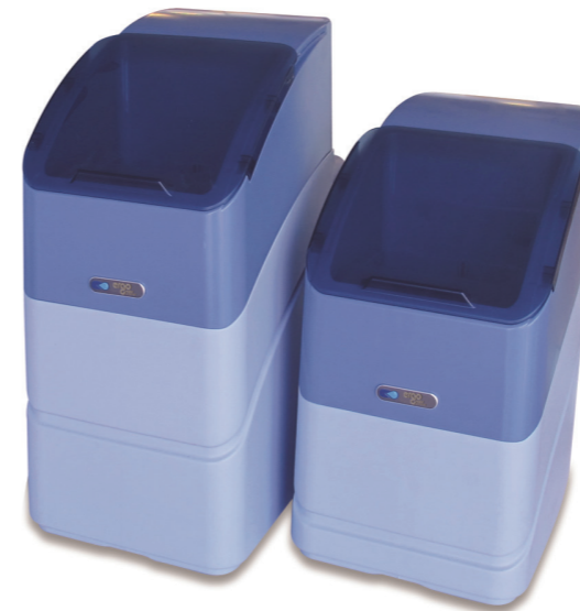
KINETICO ERGO (USA)